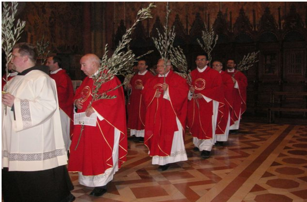
Vi følger Jesus indtog til Jerusalem – fra palmesøndags højmesse i 2007