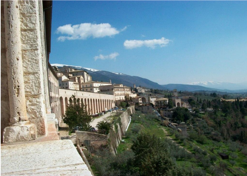
Udsigt fra søjlegangene på Sacro Convento d. 14. marts 2010 Solen og de lune temperaturer varsler forår samtidigt med, at sneen stadigvæk ligger på Subasio og andre bjerge