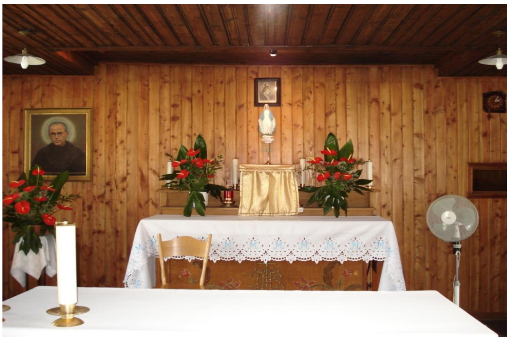
Maximilian Kolbes ydmyge trækirke på Niepokalanow, hvor han fejrede utallige messer. Maleriet til venstre er Maximilian Kolbe

Da mange deltagere i kurser, hvor vi har haft et fokus på den franciskanske mystik, inkl. Maximilian Kolbe, har efterspurgt bogen, der det mig en glæde at kunne fortælle, at den forventes at udkomme i maj måned. Et særligt nyhedsbrev vil naturligvis blive udsendt.